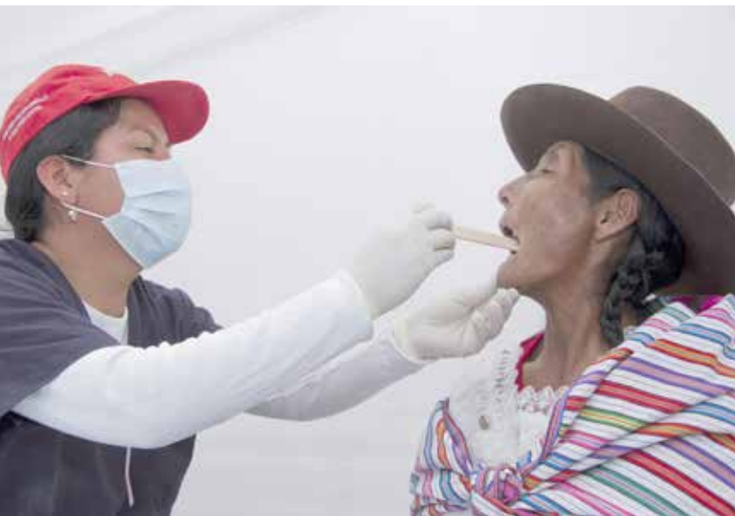
▲ Atención especializada a su servicio.