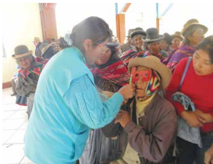
▲ Se realizaron dos campañas de operaciones de cataratas en Puno y Apurímac

10 * Servicios complementarios: más allá de una pensión