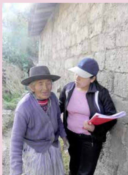
▲ Los equipos territoriales de Pensión 65 presentes en todo el país

“Se han generado nuevas necesidades que han tenido que ser colocadas dentro de las políticas de las gestiones locales y regionales. Ahora en el Gobierno Regional de Ayacucho existe un programa de Vejez Saludable que antes no había”, resaltó.