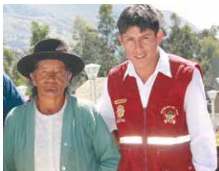
▲ Ejemplo de funcionario.

Los adultos mayores tienen que estar inscritos en el Seguro Integral de Salud (SIS) para participar en las campañas de salud que son parte de los servicios complementarios de Pensión 65 . Los días de pago, ya sea en las agencias del Banco de la Nación o la plaza de alguna comunidad, son aprovechados para que los usuarios del programa puedan inscribirse al SIS.