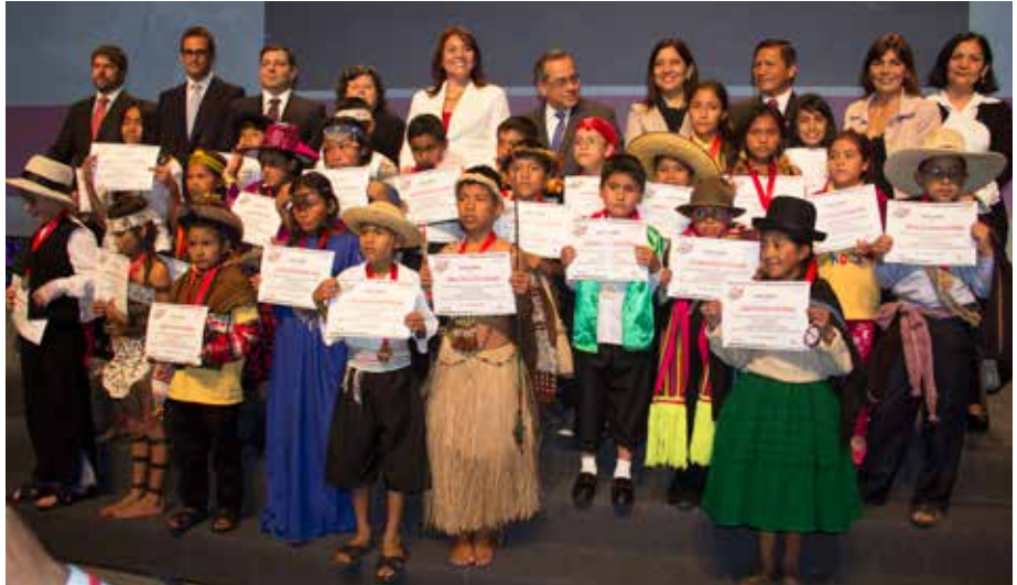
Los 27 niños ganadores recibieron el reconocimiento por sus trabajos presentados.