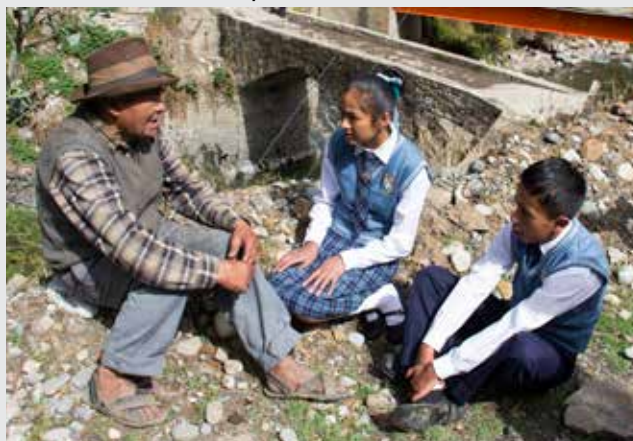
Niños se convirtieron en aliados estratégicos para cambiar mirada de la sociedad sobre adultos mayores