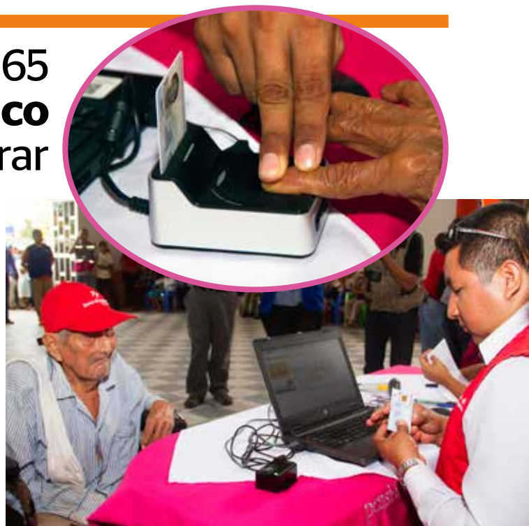
Adultos mayores de Caynarachi cobraron su pensión con mayores facilidades y sin necesidad de firmas.

“Nuestros adultos mayores son vulnerables al tema de las estafas y las suplantaciones. En los últimos años pudimos identificar algunas, pero no superan las 60. Como tenemos un seguro mediante el Banco de la Nación, todos los casos fueron revertidos, a la par que pudimos identificar a los culpables”, señaló José Villalobos, director ejecutivo de Pensión 65.