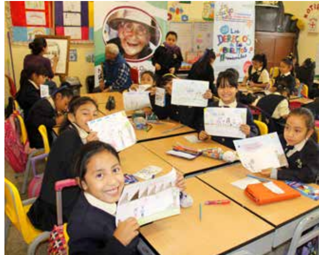
Niños de diferentes partes del país presentaron sus trabajos, con la asesoría de sus profesores.

El concurso que lanzó hace dos años Pensión 65 como iniciativa para promover la sensibilización hacia la temática del adulto mayor casi cuadruplica la participación del primer año, cuando se inscribieron 13,937 escolares.