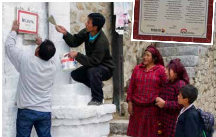
Señalización de calles y espacios públicos se vivió en un ambiente de fiesta.

La comunidad Jaqaru, Pensión 65 y la municipalidad de Tupe se unieron para hacer realidad la instalación de la señalética bilingüe. Los textos de los letreros fueron revisados por docentes y autoridades bilingües de Tupe, Colca y Aiza, bajo la orientación minuciosa de los adultos mayores y con la