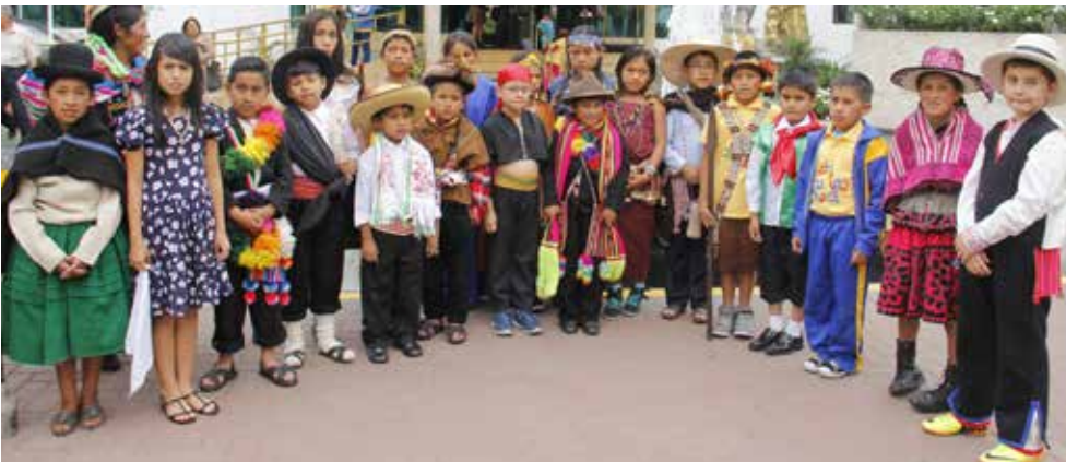
Ganadores de "Los Abuelos Ahora" fueron premiados durante la Semana de la Inclusión del MIDIS.

Los dibujos, cuentos y poemas de los niños se enfocaron en los derechos de los abuelos de su comunidad.