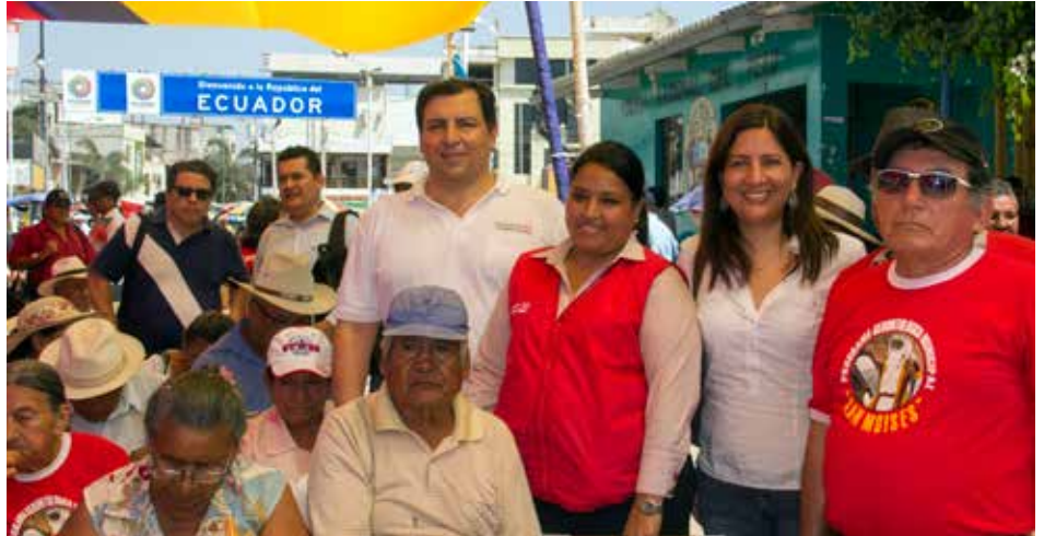
Autoridades y adultos mayores peruanos y ecuatorianos compartieron experiencias y conocimientos.

En Ecuador, la política de asistencia integral para mejorar la calidad de vida de los adultos mayores la llevan a cabo los Gobiernos Autónomos Descentralizados, como la Municipalidad de Huaquillas, que realiza este trabajo a través de la Unidad Básica de Rehabilitación Integral.