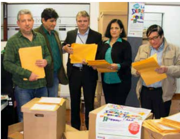
Jurados calificaron trabajos en sede central de Pensión 65, en Lima.

Colchado recuerda que él escribe desde los 14 años. Escribía cuentos y poemas que publicaba en el periódico mural