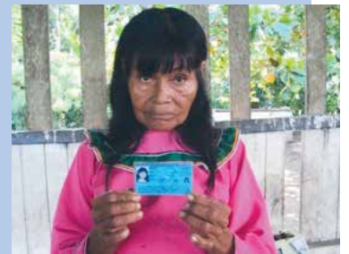
▲ En Ucayali aún existen muchos adultos mayores indocumentados en diversas comunidades alejadas.

Tras obtener su DNI a fines de enero último, estos veinte nativos shipibo conibo pudieron postular a ser usuarios de Pensión 65 , con el objetivo de recibir la subvención económica bimestral de 250 nuevos soles que entrega el Estado.