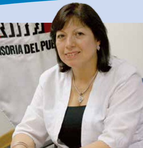
▲ Adjunta de la Defensoría del Pueblo considera que atención de adultos mayores es un tema de justicia social.

última caracterizada por adultos mayores que no tienen DNI y que por tanto, no cumplen con uno de los requisitos para acceder al programa.