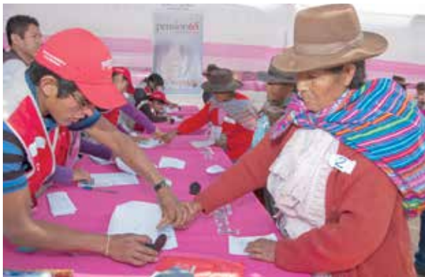
▲ Pensión 65 llegó a San Antonio de Esquilache, Puno, uno de los distritos más pobres del país, según cifras oficiales.

Como parte del esfuerzo por llegar a las comunidades y poblados rurales más alejados del país, el equipo central de Pensión 65 supervisó en una de las localidades más pobres del país, en el centro poblado Juncal del distrito puneño de San Antonio de Esquilache, una jornada de pago y una campaña de salud realizada a más de 4,500 metros sobre el nivel del mar.