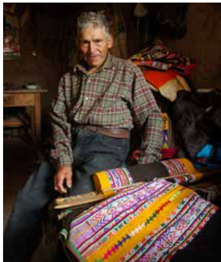
▲ La identificación de los saberes tradicionales se ha iniciado en dos distritos de Ayacucho

Con las primeras visitas a los distritos