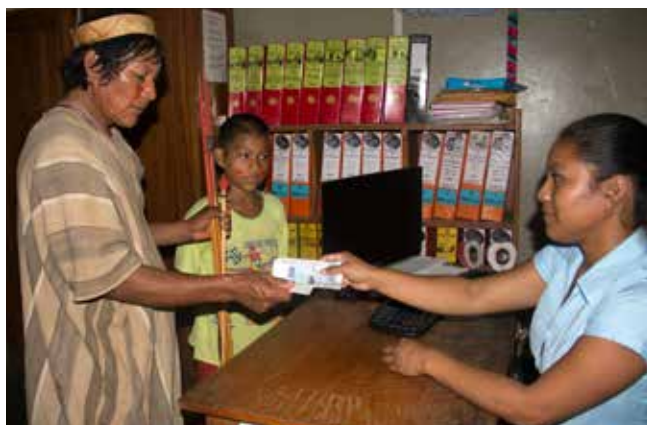
El certificado ISO garantiza que Pensión 65 pone controles de seguridad en la transferencia de fondos al Banco de la Nación.

El certificado internacional es un reconocimiento a la calidad de gestión del programa y garantiza que Pensión 65 cumple con un alto estándar en su proceso de transferencia monetaria.